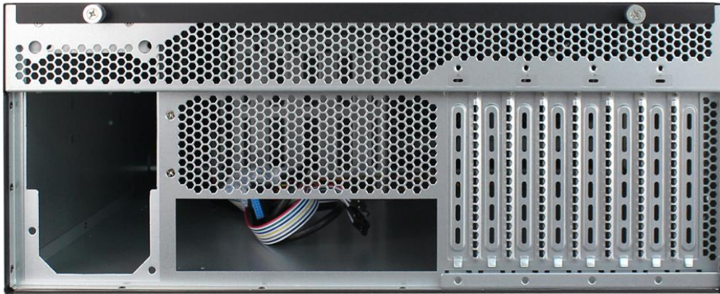
机箱内部结构及尺寸如下图所示